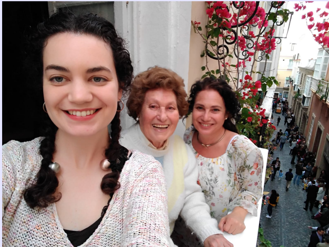
(Imagen de entrañable de Rafaela con su hija y nieta)