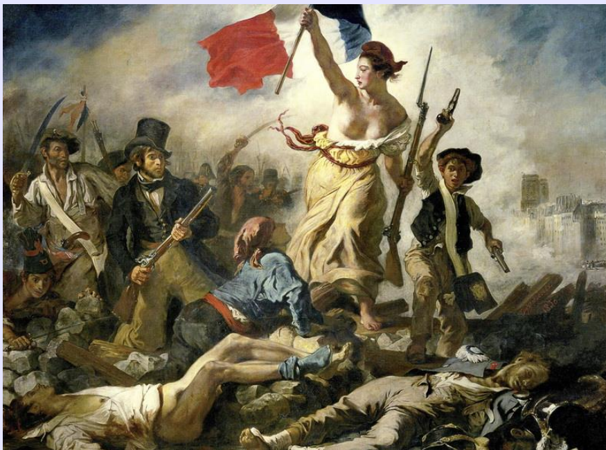
(La libertad guiando al pueblo - Delacroix)